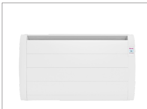
Detalle electrónica L | L2000