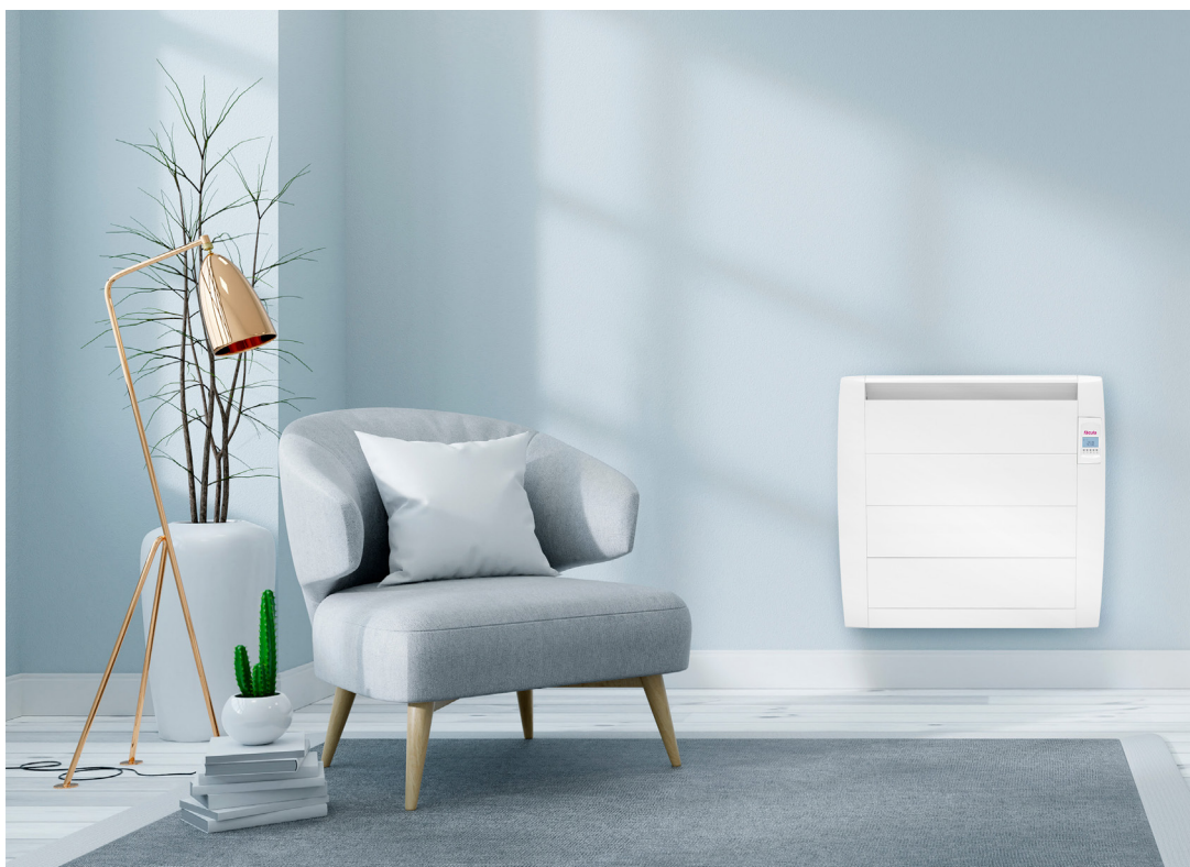
Modelo expuesto L0900