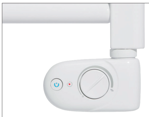
T700+ | Detalle interruptor | Detalle control