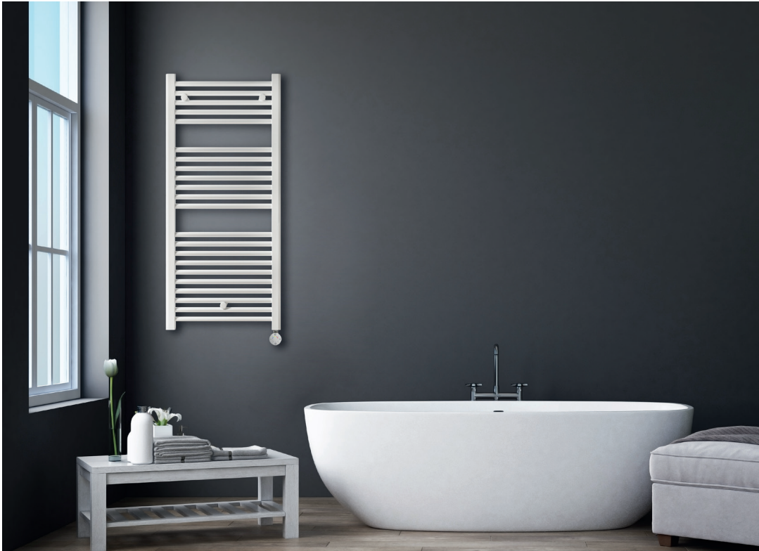
Modelo expuesto T700D (1166 x 500 mm) | Blanco recto

TOALLERO ELÉCTRICO FLUIDO CON CONTROL DIGITAL