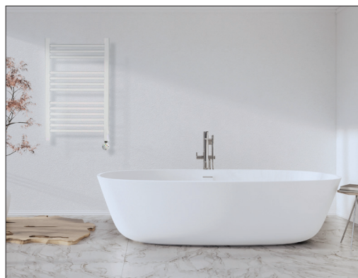
Detalle funcionamiento | Escena T400CRD | Escena T400D