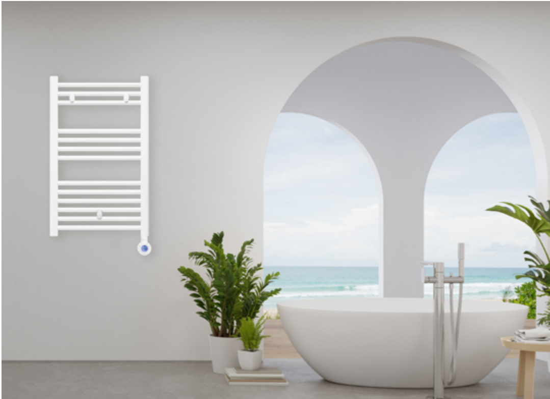
Modelo expuesto T401R (900,5 x 500 mm) | Blanco recto

TOALLERO ELÉCTRICO FLUIDO CON CONTROL PROGRAMABLE