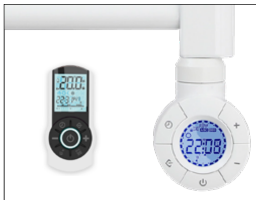
T700NER | Escena T500CRR | Detalle control TR y mando a distancia (NO incluido)